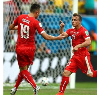
La Nati durant la Coupe du monde de football au Brésil

La couverture médiatique étrangère en lien avec la Suisse n'est pas particulièrement élevée au cours du troisième trimestre 2014. Différents dossiers bancaires et fiscaux impliquant notamment UBS et la filiale suisse de BNP Paribas renvoient une image plutôt mitigée de la place financière helvétique dans la presse internationale. Celle-ci salue en revanche les efforts de la Suisse en matière fiscale, à l'occasion notamment des propositions du Conseil fédéral concernant la réforme de l'imposition des entreprises (RIE III) ou lors de la publication des résultats des banques privées Pictet et Lombard Odier. La position de la Suisse vis-à-vis des sanctions internationales contre la Russie suscite des commentaires parfois critiques. Enfin, différents événements liés à l'économie et à l'industrie helvétique suscitent l'intérêt de la presse étrangère, dont un possible impact de la sortie de l'Apple Watch sur l'industrie horlogère suisse. C'est par ailleurs une étude de l'Université de Zurich, selon laquelle un nombre croissant d'étrangers recourrait au suicide assisté en Suisse, qui connaît un vif retentissement. En matière sportive, enfin, les performances de l'équipe suisse de football lors de la Coupe du monde au Brésil donnent lieu à des commentaires positifs.