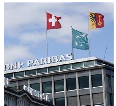
Rapport d'enquête de la Finma contre BNP Paribas