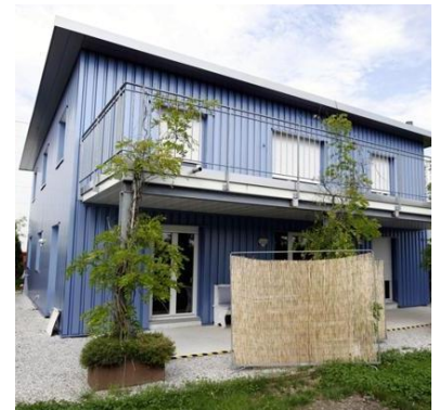
Clinique Dignitas